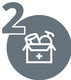
KOMPLET ZA PREŽIVLJAVANJE